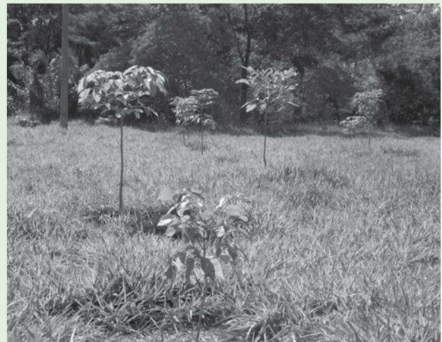
Foram plantadas cerca de 60 mil mudas de espécies nativas

As ações da Fundação Neotrópica em parceria com os produtores rurais têm mostrado bons resultados. Conheça melhor as ações visitando o site www.fundacaoneotropica.org.br ou pelo telefone (67) 3255-3462.