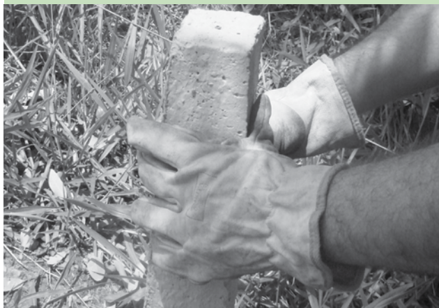
O projeto oferece georreferenciamento da propriedade

N a Microbacia do Rio Mimoso, as ações de conservação ambiental têm um foco diferente: a regularização da reserva