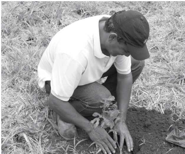
Propriedades são recuperadas com plantio de mudas

E m 2007 a Fundação Neotrópica passou a auxiliar os produtores da Microbacia do Rio Anhumas na recuperação das margens de rios e nascentes através do Projeto Nascentes do Anhumas. As ações realizadas nos rios Anhumas, Serradinho,