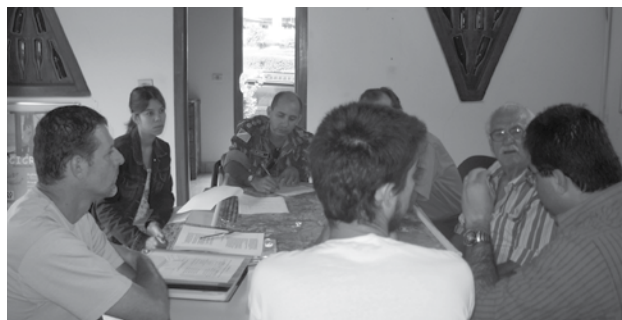
Proprietários e instituições parceiras compõem o Conselho

Um modelo participativo nas decisões dos projetos