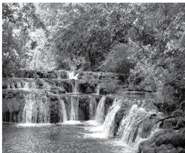
Quanto vale a paisagem que você vê todos os dias?

A ideia é criar um fundo com doações voluntárias de turistas que visitam Bonito e empresários em geral, para remunerar os produtores que têm boa conduta ambiental em