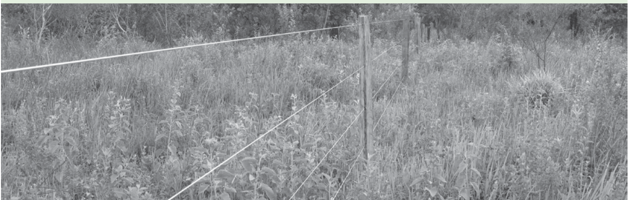
90% das áreas de mata ciliar a serem recuperadas estão isoladas