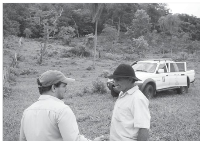
Os projetos da Fundação Neotrópica oferecem assessoria técnica gratuita

Os projetos realizados nas bacias dos rios Formoso, Mimoso, Anhumas, entre outras, oferecem orientação técnica, plantio de mudas nativas, georreferenciamento das propriedades e organização da documentação da área para regularizar a reserva legal, de acordo com a avaliação técnica da equipe.