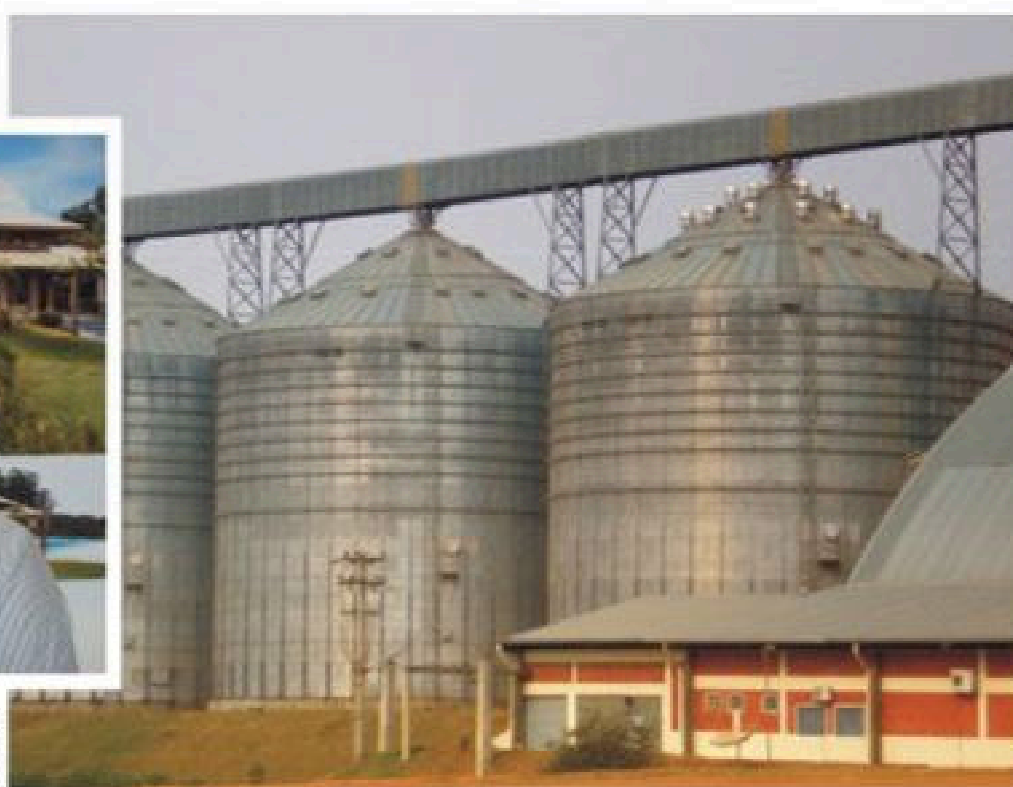
Unidade de Armazenagem | Campo Verde - MT