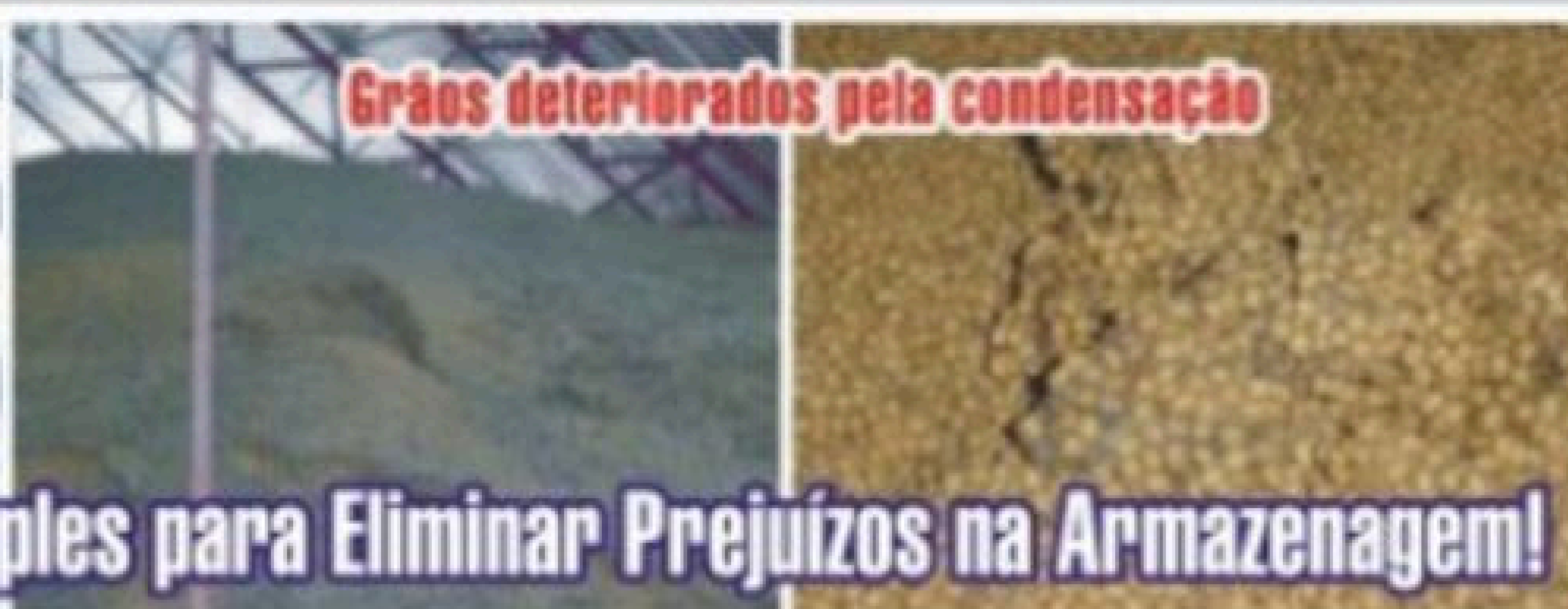
Grãos deteriorados pela condensação

Tecnologia Simples para Eliminar Prejuízos na Armazenagem!